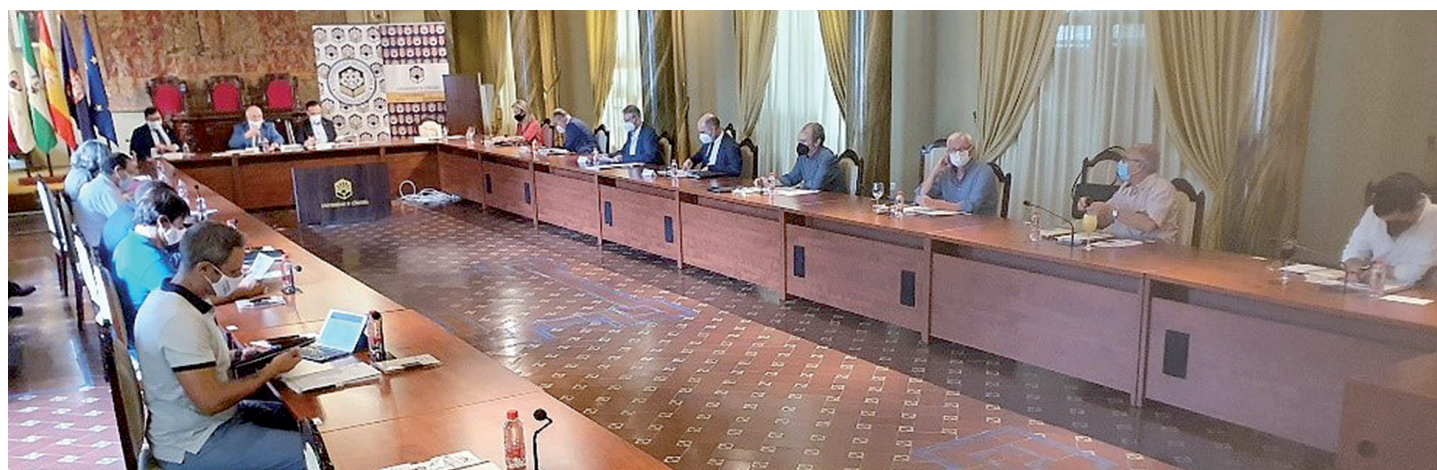
Imagen del pleno del Consejo Social en julio de 2021.

← atribuciones que se asigna a los consejos sociales y la capacidad real que tienen a la hora de ejercerlas eficazmente. No hay que olvidar que estos órganos son los encargados de aprobar los presupuestos universitarios y de controlar su cierre. O, dicho de otra manera, se trata de un órgano que puede no aprobar un presupuesto u obligar a corregirlo.