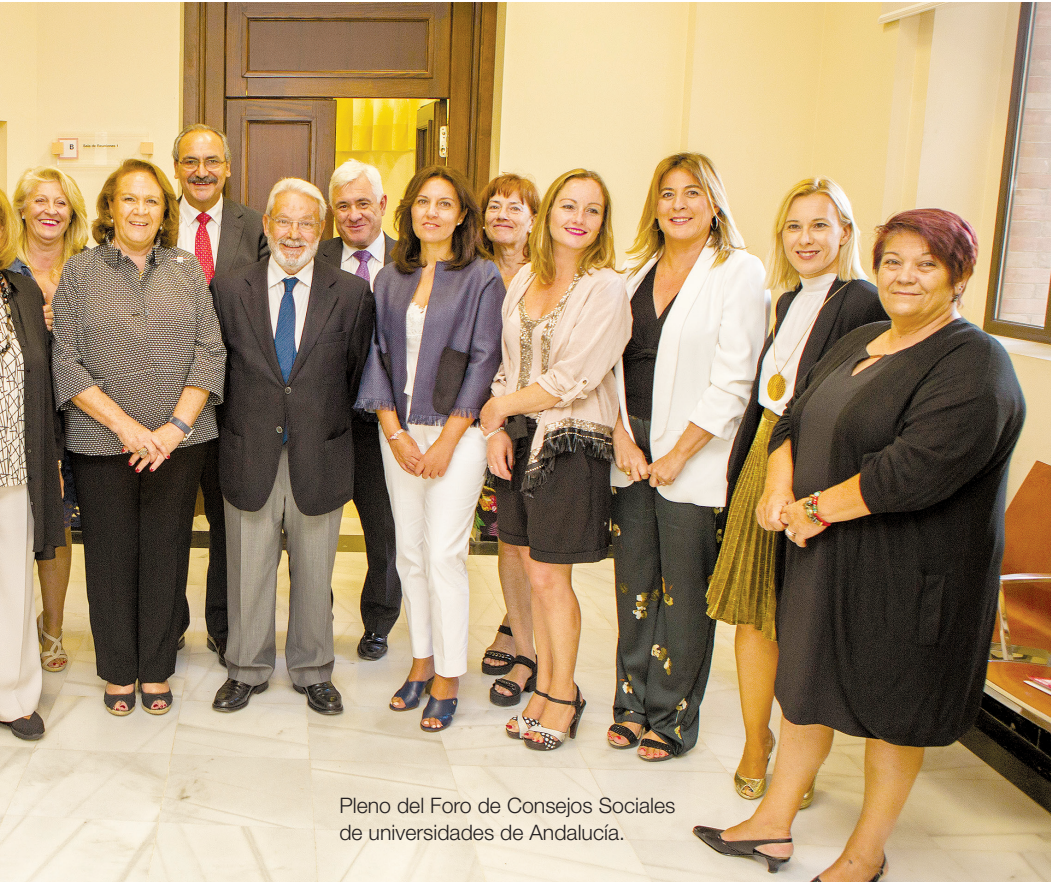
Pleno del Foro de Consejos Sociales de universidades de Andalucía.

frecuentemente sobre si sus perfiles se ajustan o no a la labor a desarrollar en su seno, la compatibilidad de esta con otras actividades, posibles conflictos de intereses, controles desde el poder, su utilización como lugares de acomodo... Cuestiones que se suman a otras, frecuentes como la anterior en los medios de comunicación, como es el caso de la endogamia universitaria (según un informe del CSIC, publicado en 2014, el 73% de los profesores universitarios españoles están contratados en los centros en que leyeron sus tesis) y que, en conjunto, se articulan en torno a la gran reflexión sobre la estructura y gobernanza universitaria que de forma genérica se está llevando a cabo. Una reflexión que incluye otros muchos aspectos como la articulación de órganos de gobierno estables y de reducido tama-