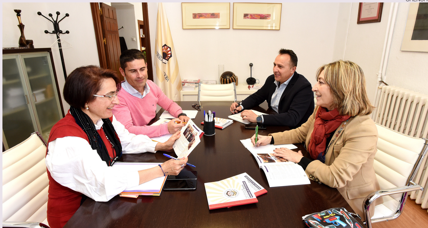
Reunión del gabinete del Consejo Social.