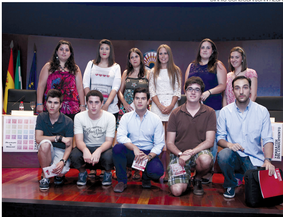
Ganadores de los premios del Maratón del Conocimiento del 2012.

← contingentes militares cordobeses desplazados en misiones al Exterior.