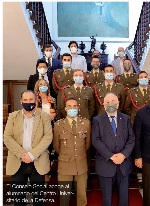
El Consejo Social acoge al alumnado del Centro Universitario de la Defensa.

Uno de los objetivos estratégicos permanentes del Consejo es orientar al alumnado y dentro de ese marco cabe citar desde 2012 el programa OrientaUCO dirigido al alumnado de Secundaria, Bachillerato y Formación Profesional en colaboración con