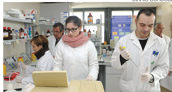
Laboratorio de la Universidad de Córdoba.