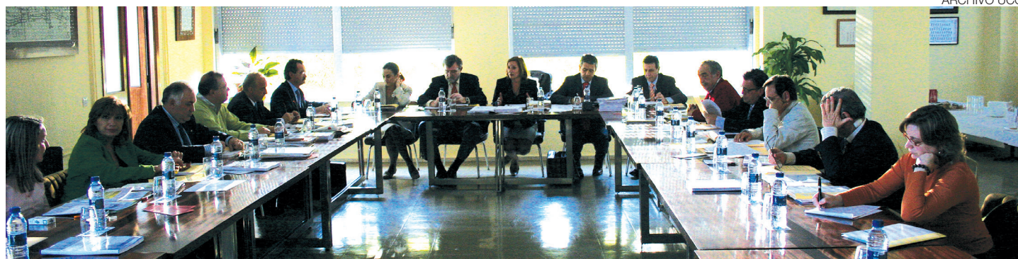
Pleno del Consejo Social celebrado en la EPS de Belmez, en marzo de 2007, en la que el Consejo Social se incorporó como patrono a FUNDECOR.