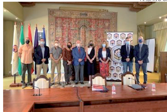
Estudios de Criminología.