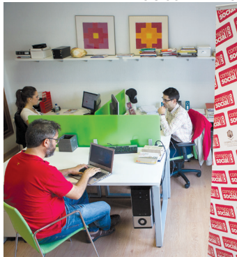
Sede del Consejo Social de la UCO.