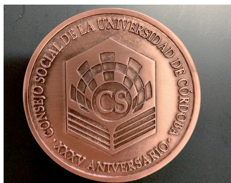
Moneda conmemorativa del 35 aniversario del Consejo Social.

En lo que se refiere al acercamiento a la sociedad de los estudiantes el Consejo busca potenciar los mecanismos de diálogo y consenso tan necesarios en los tiempos actuales y en tal línea está apoyando las actividades de debate universitario que se llevan a cabo en el seno del Aula de Debate de la Universi-