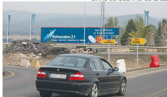
Obras en el Parque Tecnológico Rabanales 21.