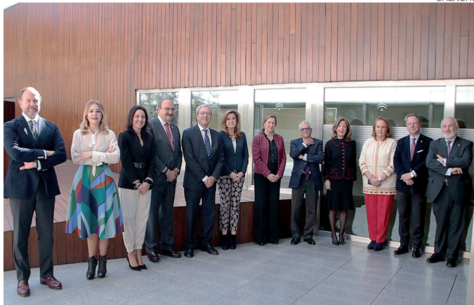
Los presidentes de los consejos sociales de Andalucía junto al consejero.