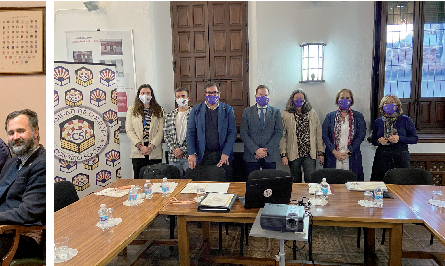
Comisión de Actividades.

Por la Comisión pasan tanto asuntos de trámite como propuestas que requieren armonizar posturas a veces antagónicas, un esfuerzo necesario no solo para agilizar la marcha de la Institución, sino también para no paralizarla o ralentizarla, actuando con cierto margen de maniobra dentro siempre de los márgenes de la Ley y del uso racional de los recursos. Ello sin demérito de actuar con sentido crítico. De hecho las comisiones suelen cerrarse con un informe que incluye recomendaciones y propuestas de mejora.