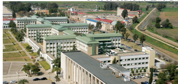
Panorámica del campus de Rabanales.

← - ¿Cómo era el Consejo Social que se encontró y cómo el que dejó tras su marcha?