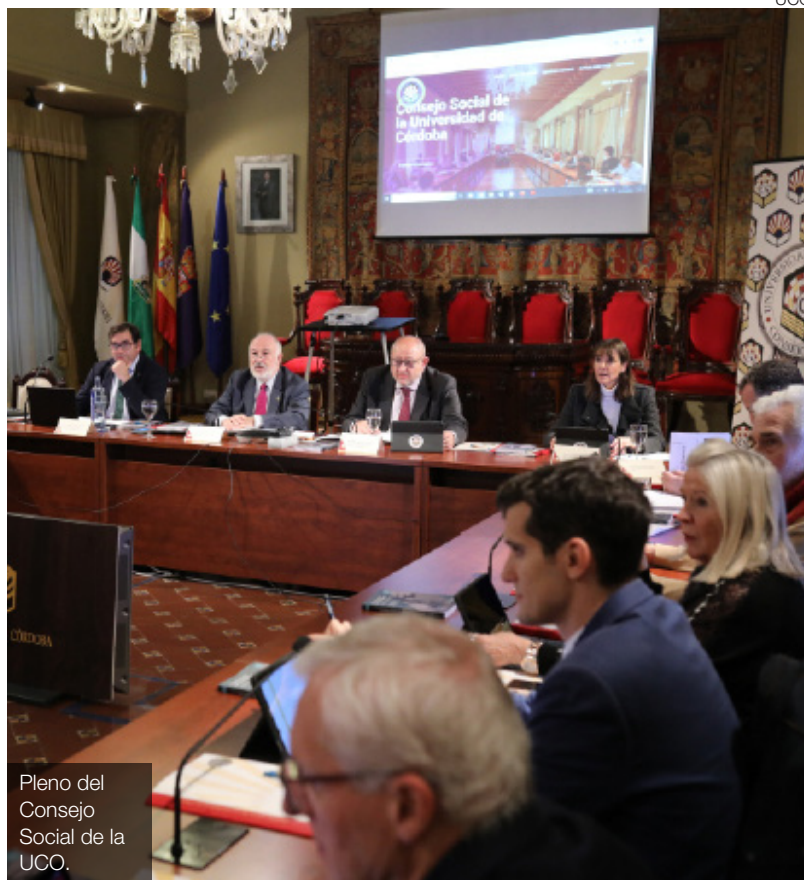
Pleno del Consejo Social de la UCO.

-Hay un eje de mi mandato que no es una actividad