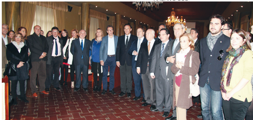
Participantes en la reunión del Consejo Social de la UCO con representantes de colegios profesionales, en diciembre de 2015.