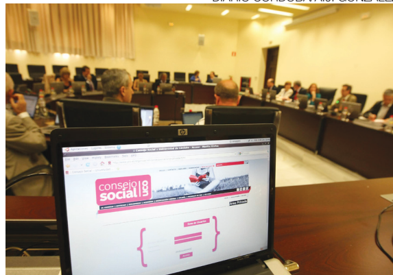
Pleno del Consejo Social de la UCO (8 de junio de 2011) en el Rectorado de la UCO.

de la Universidad a propuesta del Consejo de Gobierno.