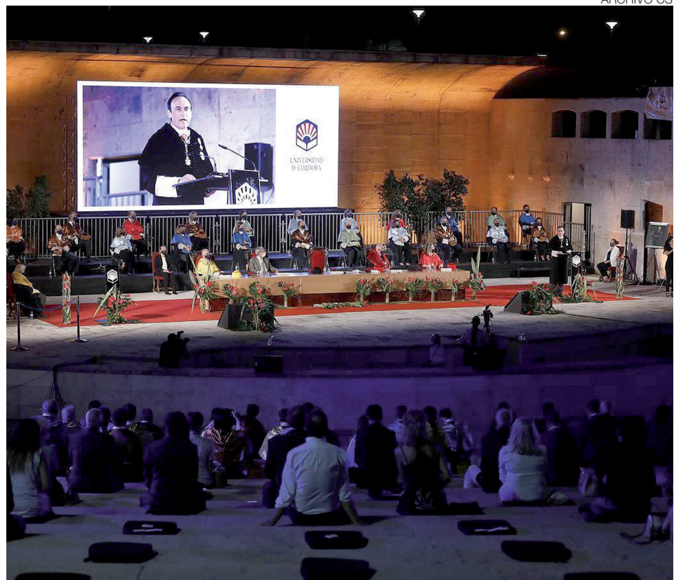
Inauguración del curso académico 2020.