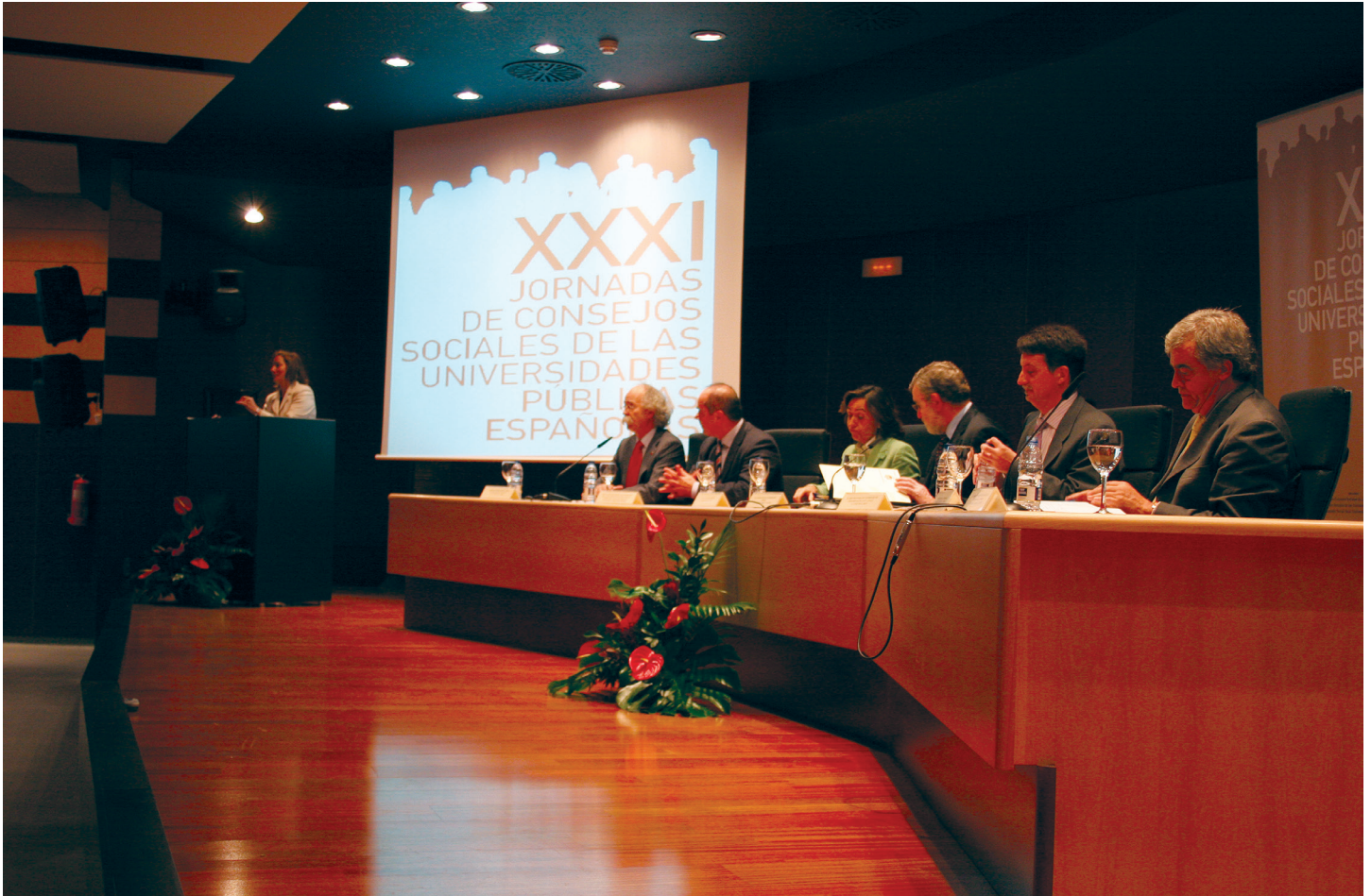
Jornadas de la Conferencia de Consejos Sociales de las universidades españolas celebradas en Córdoba en 2007.

← para la más plena realización de la dignidad humana y del pueblo andaluz”. Define al Consejo Social como “el órgano de participación de la sociedad en la Universidad” y establece su estructura y sus funciones.