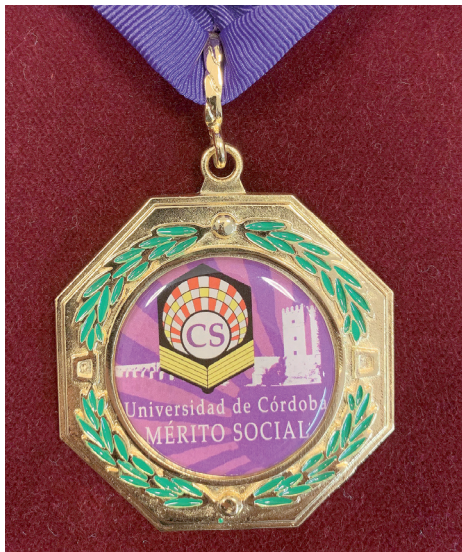
Medalla al Mérito Social.

← corresponde a la de la propia Universidad de Córdoba que desarrolla diversas sinergias en el eje universidad-empresa- defensa, pero también toda una gama de actividades de colaboración formativa, científica y cultural y de cooperación sobre el terreno, en materia científica y humanitaria con los →