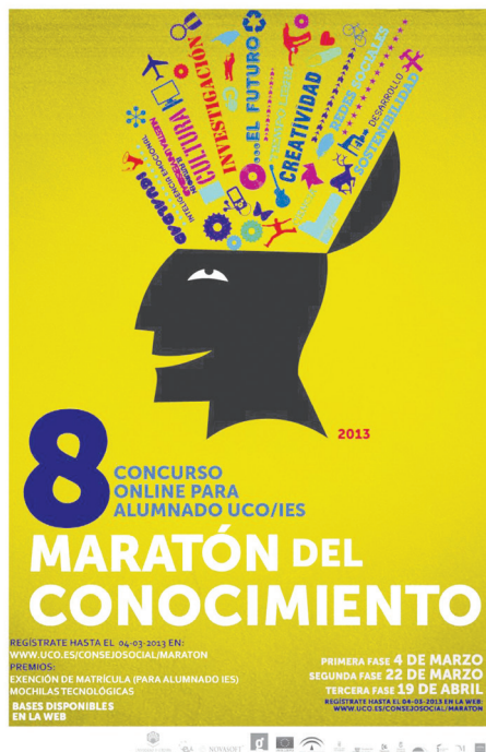
Cartel del Maratón del Conocimiento.