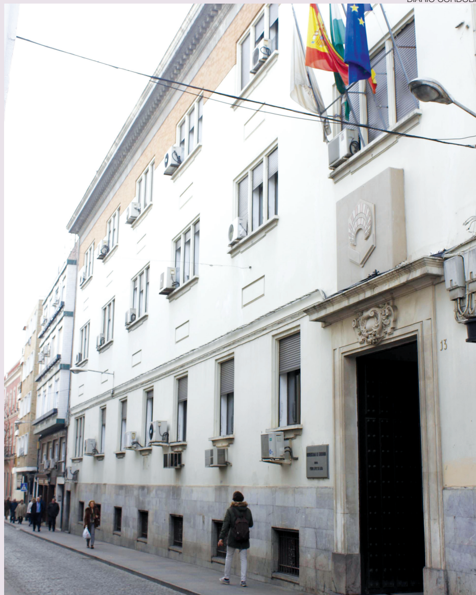
Fachada del edificio donde tiene su sede el Consejo Social.

Parte del inmueble de las Tendillas fue destinado a albergar en 1972 las dependencias del Rectorado de la Universidad de Córdoba, abiertas a la calle Alfonso XIII, en donde permanecieron hasta su traslado a la actual sede de la Avenida de Medina Azahara, antaño Facultad de Veterinaria. La escasez de espacios disponibles por entonces en una Universidad en pleno proceso de configuración hizo que, al crearse el consejo durante los años ochenta del pasado siglo, sus reuniones se celebra-