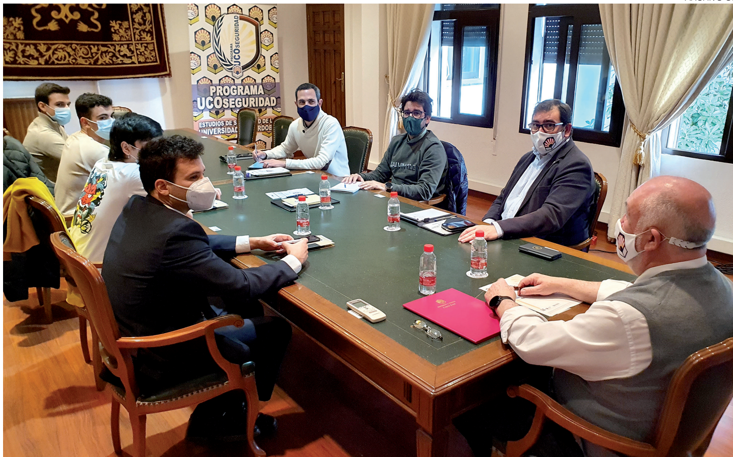
Reunión de la iniciativa estudiantil del SalmorejoTech.

estudios. Y en materia de apoyo a sectores desfavorecidos el Consejo promueve programas con Cáritas o la Fundación Don Bosco.