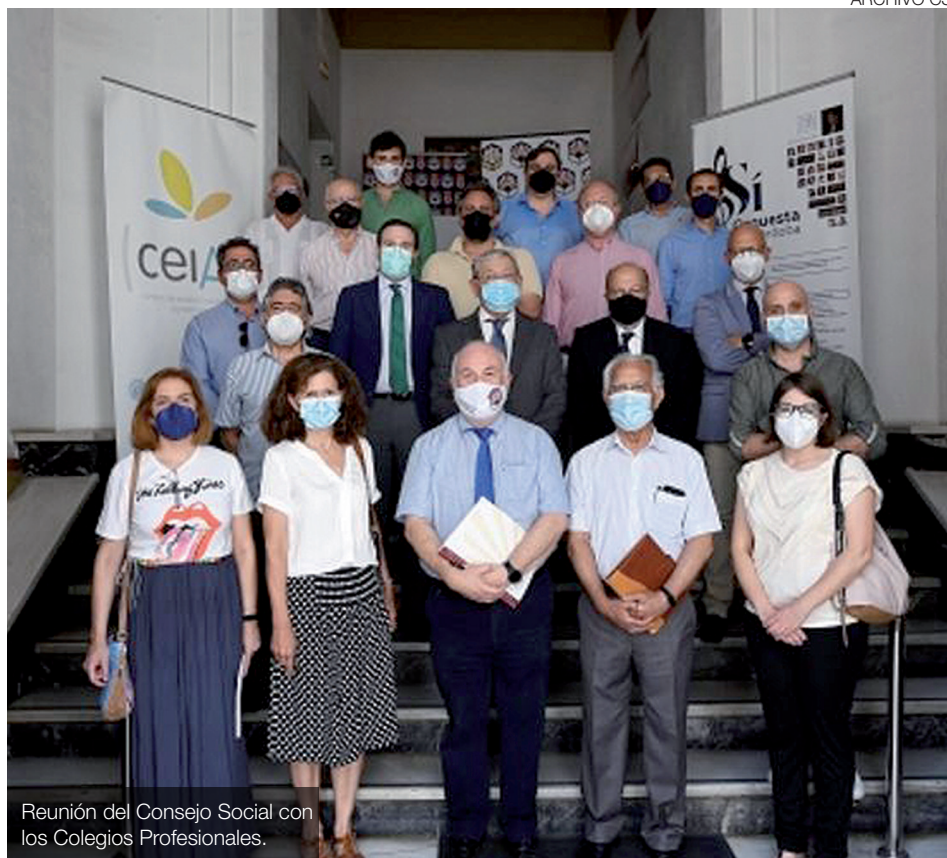
Reunión del Consejo Social con los Colegios Profesionales.

Así, por ejemplo, en lo que se refiere a necesidades formativas, se trabaja en la implantación del título de Experto Universitario en Criminología al haberse detectado una demanda a nivel social de este tipo de