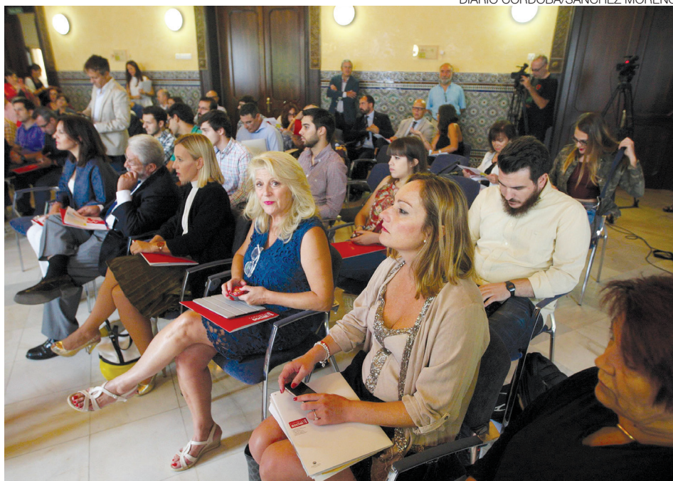
Participantes en la jornada sobre la nueva economía del conocimiento organizada en septiembre de 2021 por el Foro de Consejos Sociales de Andalucía.

ño o una mayor profesionalización dentro de la gestión universitaria, por citar solo algunos ejemplos, y que asimismo se plantea en otros países y sistemas de enseñanza superior, en torno a la cual, como sucede con tantas otras cuestiones de la vida, se elaboran alternativas que van desde la revisión permanente a la reforma o a la ruptura.