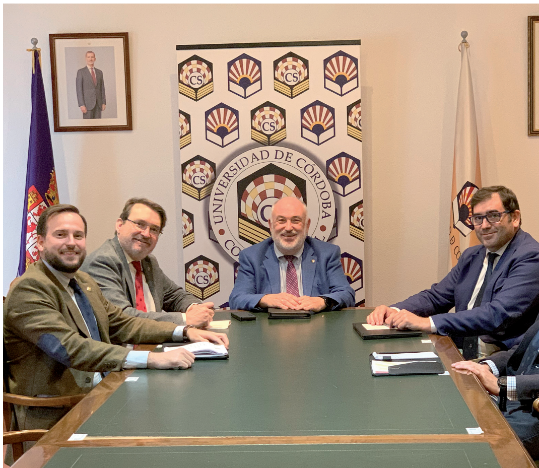
Comisión de Coordinación (2021).

en tiempo no laboral y que la coordinación cotidiana la asume la Secretaría. Las comisiones se articulan en torno al Pleno del Consejo, al que deben informar de sus actividades. Luego es la Comisión de Coordinación, que lidera el presidente del órgano colegiado quien impulsa la puesta en marcha de las acciones.