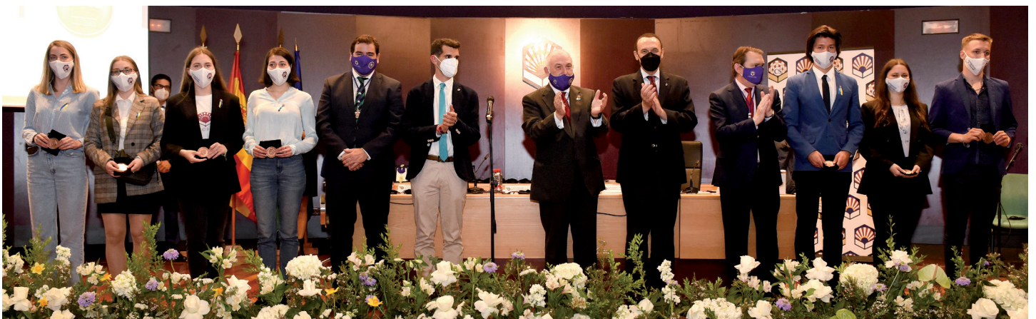
Diversos momentos del acto conmemorativo de los 35 años del Consejo Social y de la entrega de medallas a personas y entidades distinguidas con motivo de la efemérides.