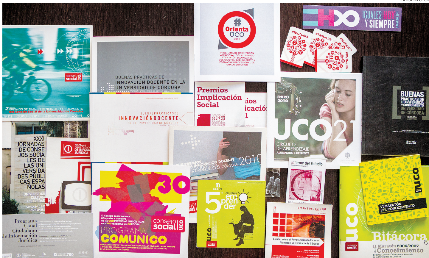
Collage de carteles y catálogos de actividades promovidas por el Consejo Social de la UCO.

← proporcionando, algo en lo que también tienen que ver los consejos sociales dadas sus competencias en materia de titulaciones y tasas universitarias. Y en general, aunque los titulados universitarios presentan una tasa de afiliación a la Seguridad Social creciente, son muchos los que ocupan puestos de trabajo no acordes a su nivel formativo e incluso han sido contratados para trabajos de carácter manual que no precisan cualificación. Armonizar formación y mercado de trabajo es también otra de las preocupaciones y asignaturas pendientes de universidades y consejos sociales.