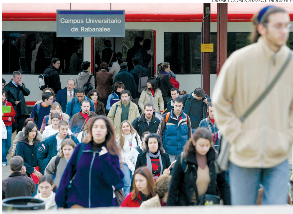
Universitarios de la UCO, en la estación de tren de Rabanales.