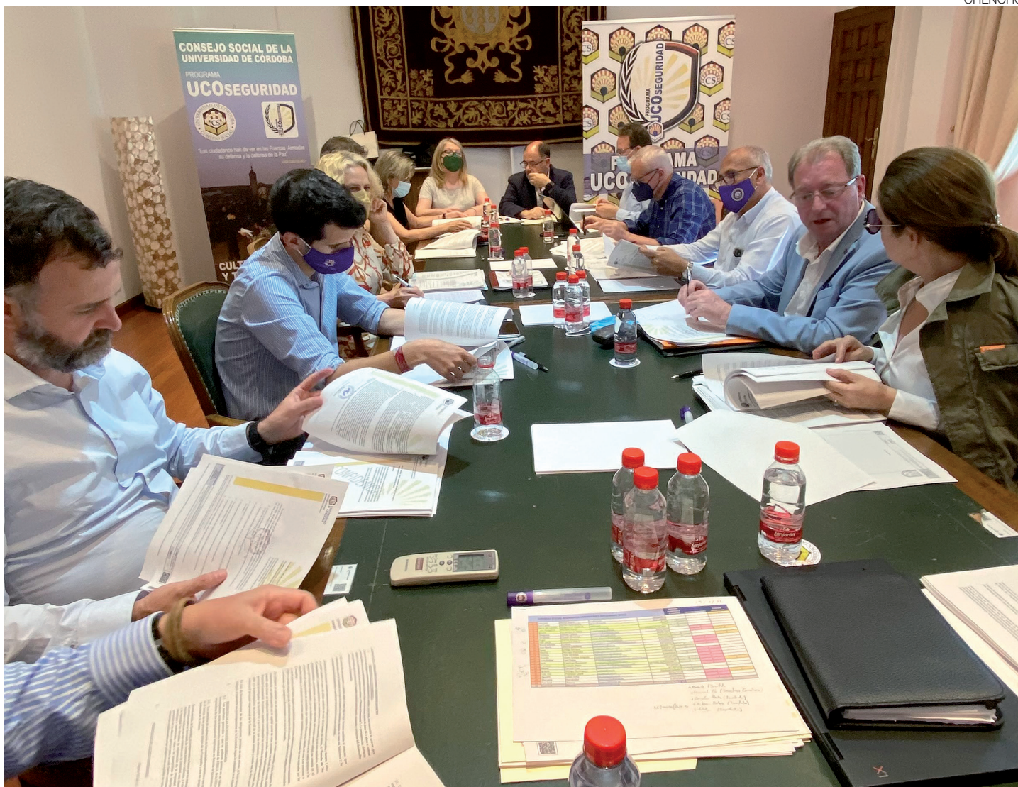
Comisión académica y económica.

trar tempranamente en contacto con los ambientes universitarios y plantearse sus vocaciones con mayor conocimiento de la realidad y de los recursos de formación y empleo a su alcance.